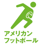
アメリカンフットボール